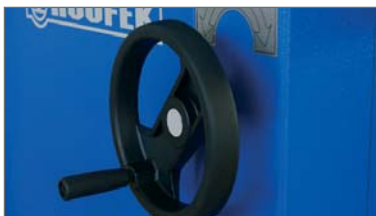
EINSTELLUNG DER AGGREGATSHÖHE