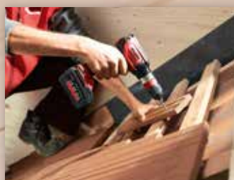
3 I 1 - ASB18 M BL

Boring i treverk med slagboremaskin med opp til 50 mm diameter er lett med A18 M bl og ASB18 M bl inkludert ekstrahåndtak.