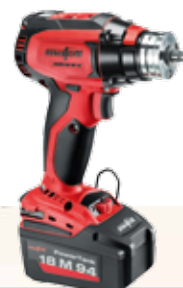
ASB18 M bl

Kraftig 18 volt modell for profesjonell bruk.