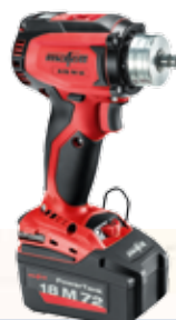
A18 M bl

Letthåndterbar 10,8 volt modell, perfekt for innendørs bruk.