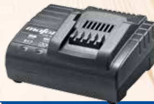
A18 M bl og ASB18 M bl